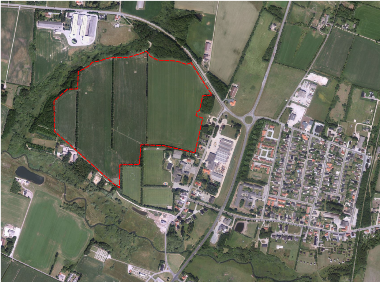
Luftfoto 2014 – arealet der udtages er markeret med rød stiplede linje